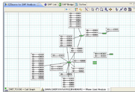
Where Used 機能の画面例